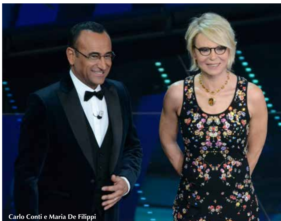
Carlo Conti e Maria De Filippi